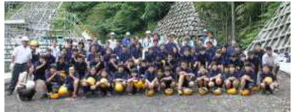
撮影の時だけマスクを外しました。

7月27日(月)に校外学習へ1年生が出かけました。古関地内で道路工事をしている古関工業さんの現場を見学することができました。橋脚の深礎部分の現場や大型クレーン車への乗車、測量機器の説明など貴重な体験をさせていただきました。全員にお土産まで用意いただきました。古関工業の皆さん、ありがとうございました。