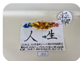
楽しい「しかけ」のある作品も...