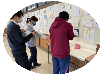
力作揃いに先生方も悩みます...